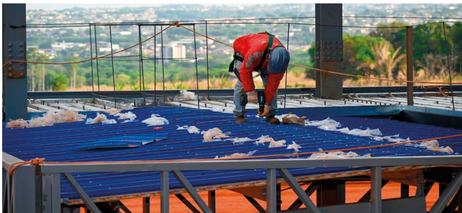
Fundações, lajes e armações da ala infantil do Complexo Oncológico de Referência de Goiás (CORA) foram finalizadas, representando 40% do total da obra.

Hospital segue modelo humanizado que alcança altos índices de cura