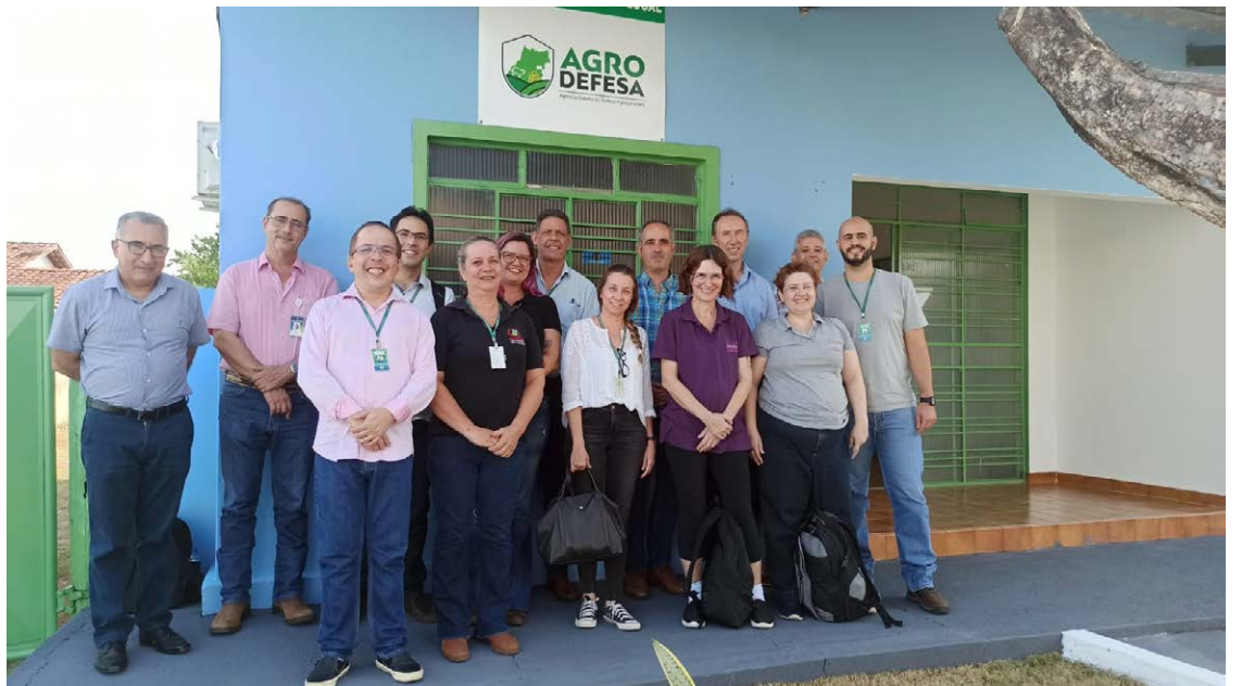
Audidores durante visita no município de Mozarlândia onde avaliaram controles de saúde animal em vigor em relação à exportação de carne bovina fresca para a União Europeia — Foto: Reprodução.

Os auditores estiveram em um frigorífico habilitado para exportação e em uma propriedade rural, conhecida também por Estabelecimento Rural Aprovado (ERAS) no Sisbov. “O foco principal foi atestar que Goiás e Brasil possuem garantias de qualidade e inocuidade dos produtos de origem animal, especialmente carne bovina exportada para o mercado europeu, além da periodicidade