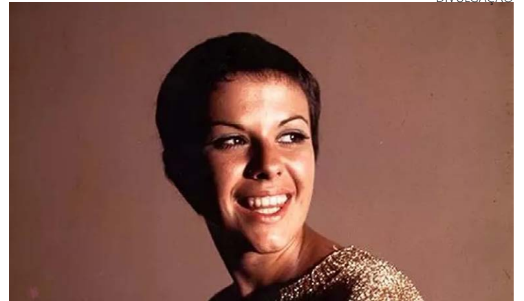
Elis Regina, estrela da música popular brasileira