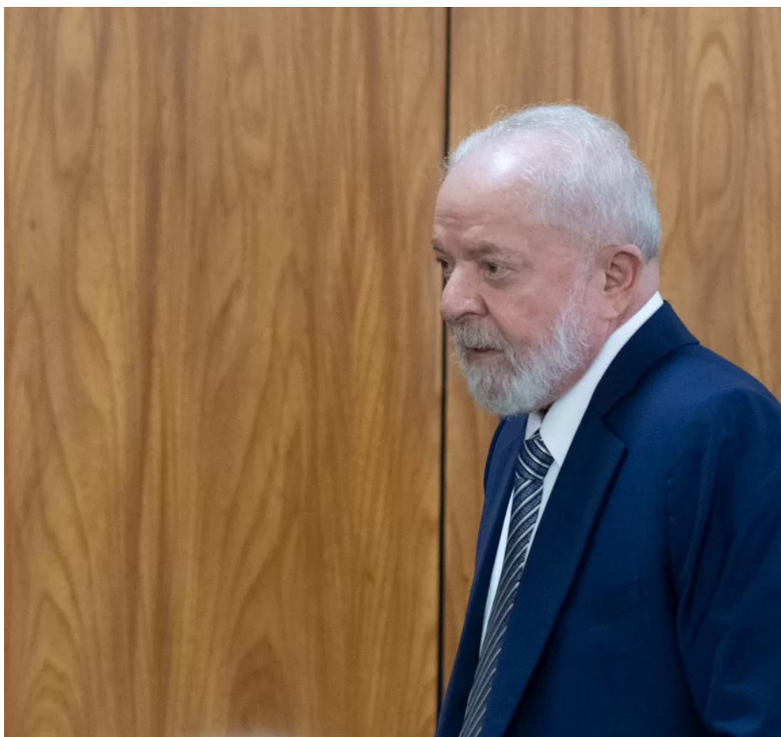
Lula com líderes dos partidos: flexibilidade para governo gastar mais com obras

A linha foi a mesma da apresentada pela ministra Simone Tebet (Planejamento e Orçamento) na reunião, que contou com cerca de 50 pessoas. Segundo apurou o Estadão, ela disse aos deputados que, se houver uma mudança meta - o que ainda não foi decidido pelo governo - não será para aumentar as despesas, mas para cumprir o que está definido no Orçamento. Isso porque, da forma como foi aprovado o novo arca-