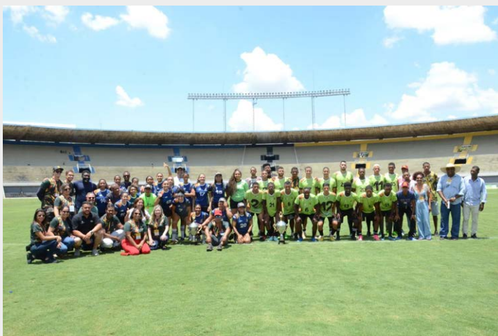
Equipe do Vão do Moleque (Cavalcante) foi bicampeã no masculino

A segunda edição da Copa Quilombola de futebol se revelou um dos eventos mais importantes do Governo de Goiás na área do esporte em 2023. A competição, que valoriza a história e cultura dos povos mais tradicionais do Estado, teve sua primeira fase realizada nas cidades onde estão as comunidades quilombolas. A segunda e a fase semifinal e final foram em Goiânia (entre os dias 20 e 22 de outubro), com jogos no Estádio Olímpico e Serra Dourada e no Centro de Treinamento do Vila Nova. Atletas e delegações, vindos especialmente de cidades do Norte e Nordeste goiano, somaram mais de 500 pessoas na Capital do Estado. Organizado pela Secretaria de Estado de Esporte e Lazer (Seel) em parceria com o Goiás Social, que desenvolve conjunto de políticas públicas voltadas para famílias em situação de vulnerabilidade, a Copa Quilombola 2023 reuniu quase dois mil participantes de 39 comunidades do Estado e teve o acompanhamento do Ministério de Igualdade Racial, que sinalizou usar o projeto realizado em Goiás como modelo para uma Copa Quilombola Nacional, com abertura em Goiânia e final no Maracanã, no Rio de Janeiro.