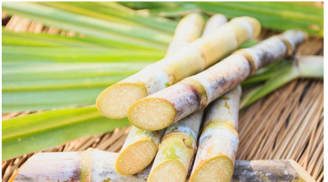
Cana-de-açúcar terá safra recorde na temporada 2023/24