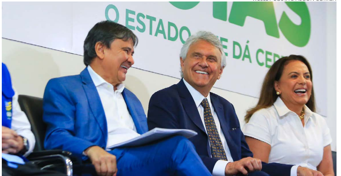
Ronaldo Caiado formaliza adesão ao Plano Brasil Sem Fome, em evento com o ministro Wellington Dias

Iniciativas como o Mães de Goiás (de repasse direto de R$ 250 mensais para famílias com crianças de zero a seis anos), o Aluguel Social (repasse de R$ 300 mensais para custeio de aluguel), Crédito Social (repasse de R$ 5 mil para início de uma atividade econômica), todas para pessoas em vulnerabilidade, dentre outras, fizeram