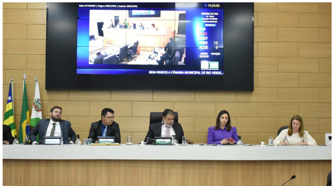
Em sessão extraordinária, Câmara aprova projeto que incentiva o esporte