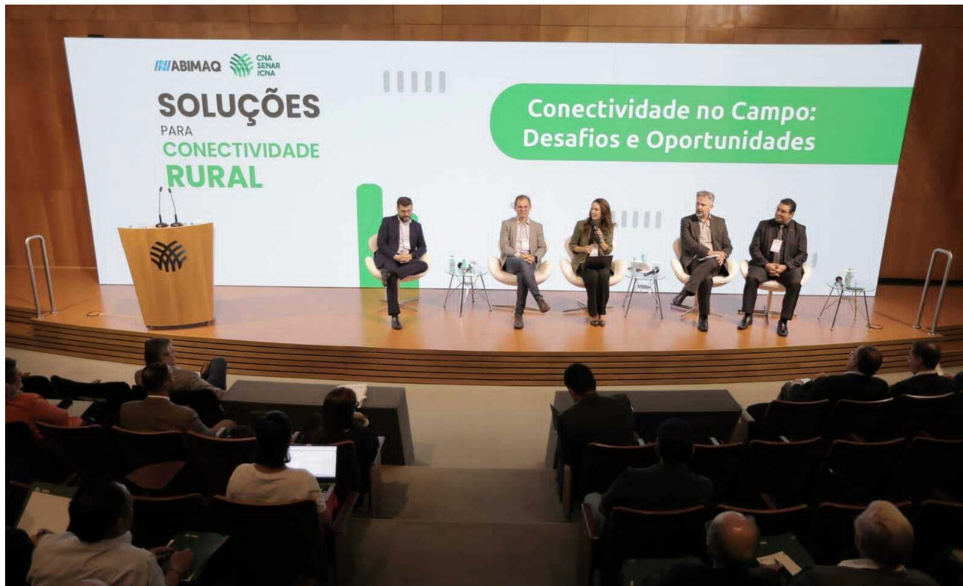
Abertura do "Soluções para conectividade rural", em Brasília, na última quinta-feira, 26/10

Assunto foi debatido em seminário promovido pela CNA e Abimaq na quinta (26)