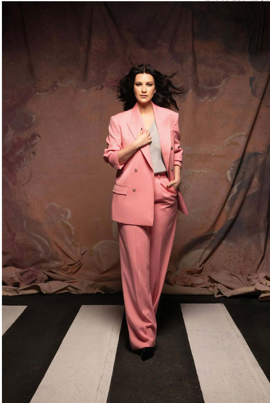
Laura Pausini, estrela do pop: mergulho em almas paralelas

A singularidade do álbum também se reflete em seus diferentes formatos, incluindo CD padrão, vinil duplo e uma versão Deluxe. Cada for-