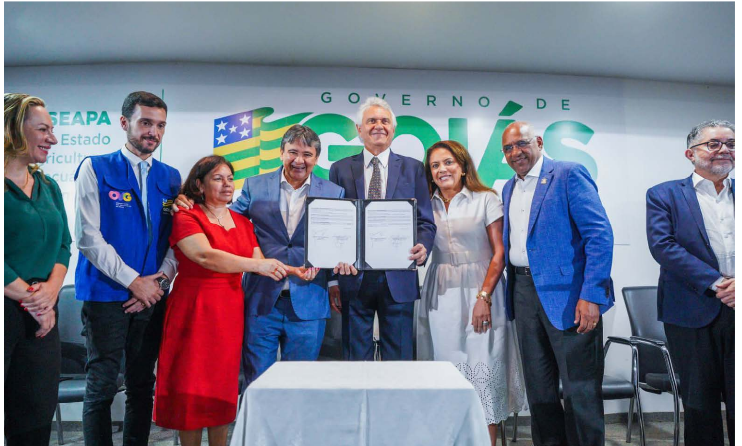
Caiado formaliza adesão ao Plano Brasil Sem Fome, em evento com a participação do ministro do Desenvolvimento e Assistência Social, Família e Combate à Fome, Wellington Dias - Foto: Wesley Costa e Hegon Corrêa.

O Governo de Goiás trabalha no âmbito social a partir de dois eixos, que foram detalhados pelo governador: emergencial, para garantir segurança alimentar e outros direitos básicos; e o emancipatório, que utiliza a capacitação profissional, educação e incentivo ao empreendedorismo como forma de promover autonomia. “Foi assim que conseguimos, nos últimos 4 anos e 10 meses, reduzir o número de pessoas em situação de pobreza e extrema pobreza inscritas no CadÚnico. É a mudança que